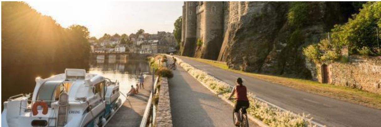
Josselin, de Oust en het kasteel

In het begin van de negentiende eeuw startte Napoleon I vanwege militaire overwegingen de bouw van het kanaal van Nantes naar Brest. Het kanaal, dat uiteindelijk geen militaire functie heeft gehad, bestaat uit 6 pittoreske riviertjes die door kanalen met elkaar zijn verbonden, en die, afgezien van de Erdre, nog de karakteristieke uitstraling van kleine riviertjes hebben. Het “kanaal” is 364 kilometer lang, waarvan 73 km gegraven kanaal. Vanwege de lokale hoogteverschillen wordt er via de sluizen zowel omhoog als omlaag gesluisd waarbij gebruik wordt gemaakt van waterreservoirs op de hooggelegen terreinen om te zorgen dat er altijd voldoende water is om te sluisen.