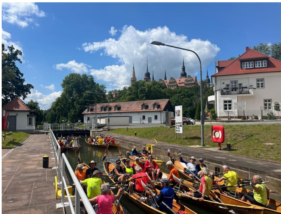
Saale Unstrut 2024

Alle betalingen voor zowel de toertochten als voor het botenwagenproject kunnen overgemaakt worden op rekeningnummer NL23 INGB 0000103978 ten name van Toercommissie KNRB. Vermeld de toertocht (locatie, toer I of II) of de botenwagen locatie (locatie met bijbehorend weeknr). En, niet te vergeten , vermeld, om verwarring te voorkomen, bij de betaling de naam zoals vermeld in je KNRB-lidmaatschap. Inschrijvingen worden verwerkt na ontvangst van de aanbeting.