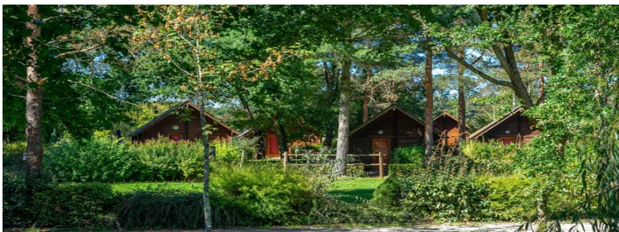
Chalets Domaine du Cerf Blanc