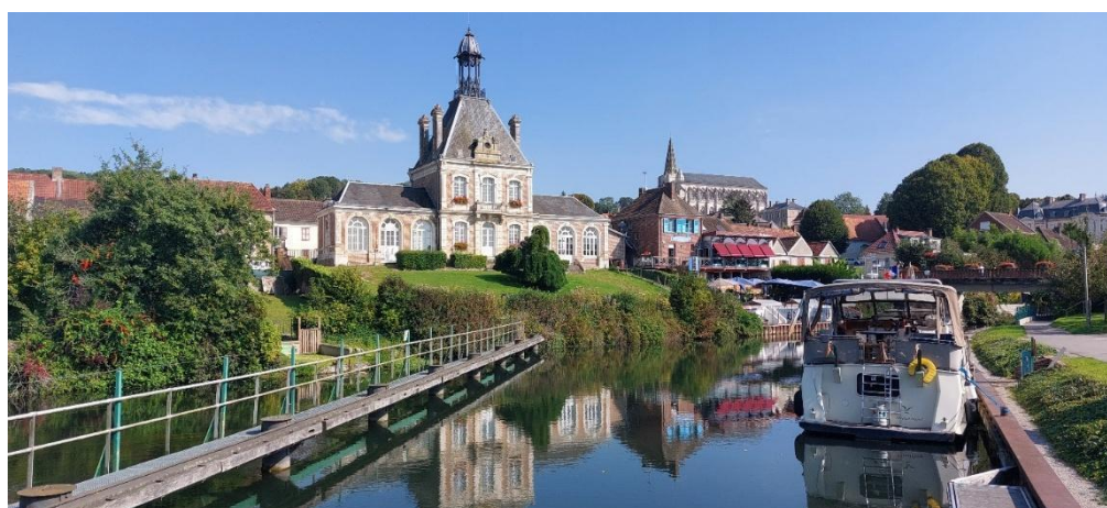
Vallei van de Somme, Stadhuis van Long